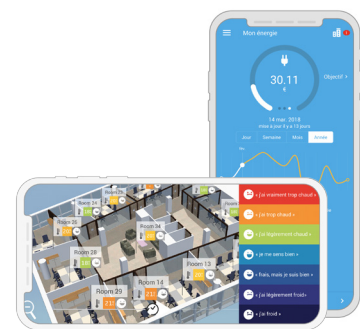
Application Smartphone et tablette