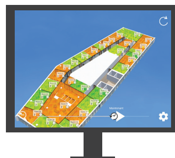
Plateforme Jumeau Numérique

Pour en savoir davantage, contactez : Kevin DOS SANTOS 06 32 22 32 00